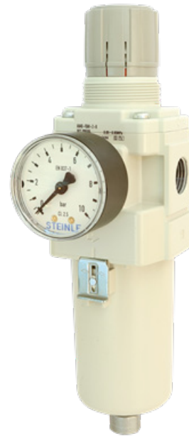
Abbildungen können von tatsächlich gelieferten Geräten abweichen

Lieferbar in 4 Baugrößen, jeweils passend zu den verschiedenen Pumpengrößen. Dieser Filterdruckminderer sollte immer in der Druckluftversorgung zum Schutz der Pumpe installiert werden!